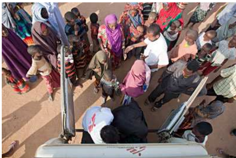
L'ambulance MSF emmène les réfugiés affaiblis et identifiés par les équipes médicales au centre d'accueil. MSF profite de ce premier point d'interaction avec les réfugiés pour examiner et vacciner les enfants et les familles récemment arrivés de Somalie.