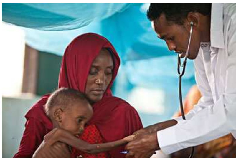
Un enfant atteint de malnutrition sévère examiné par un médecin de MSF à Dagahaley, l'un des trois camps de Dadaab. Des milliers de réfugiés somaliens arrivent chaque jour, après avoir fui la sécheresse et la guerre civile en Somalie.